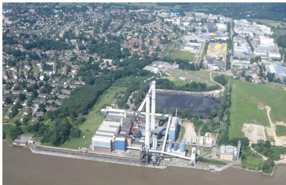
Abbildung 1: Lage des Heizkraftwerkes Wedel an der Elbe, unmittelbar an der westlichen Grenze der Stadt Hamburg